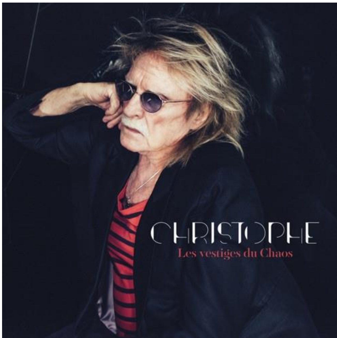
Danh ca Pháp Christophe.

Giọng ca từng làm bao thế hệ người Việt say mê đã vĩnh viễn rời xa cõi tạm. Từ nay mỗi khi nghe lại Aline, Main dans la main, Oh! mon amour... chắc rằng không ai có thể quên danh ca Christophe lãng tử, hào hoa.