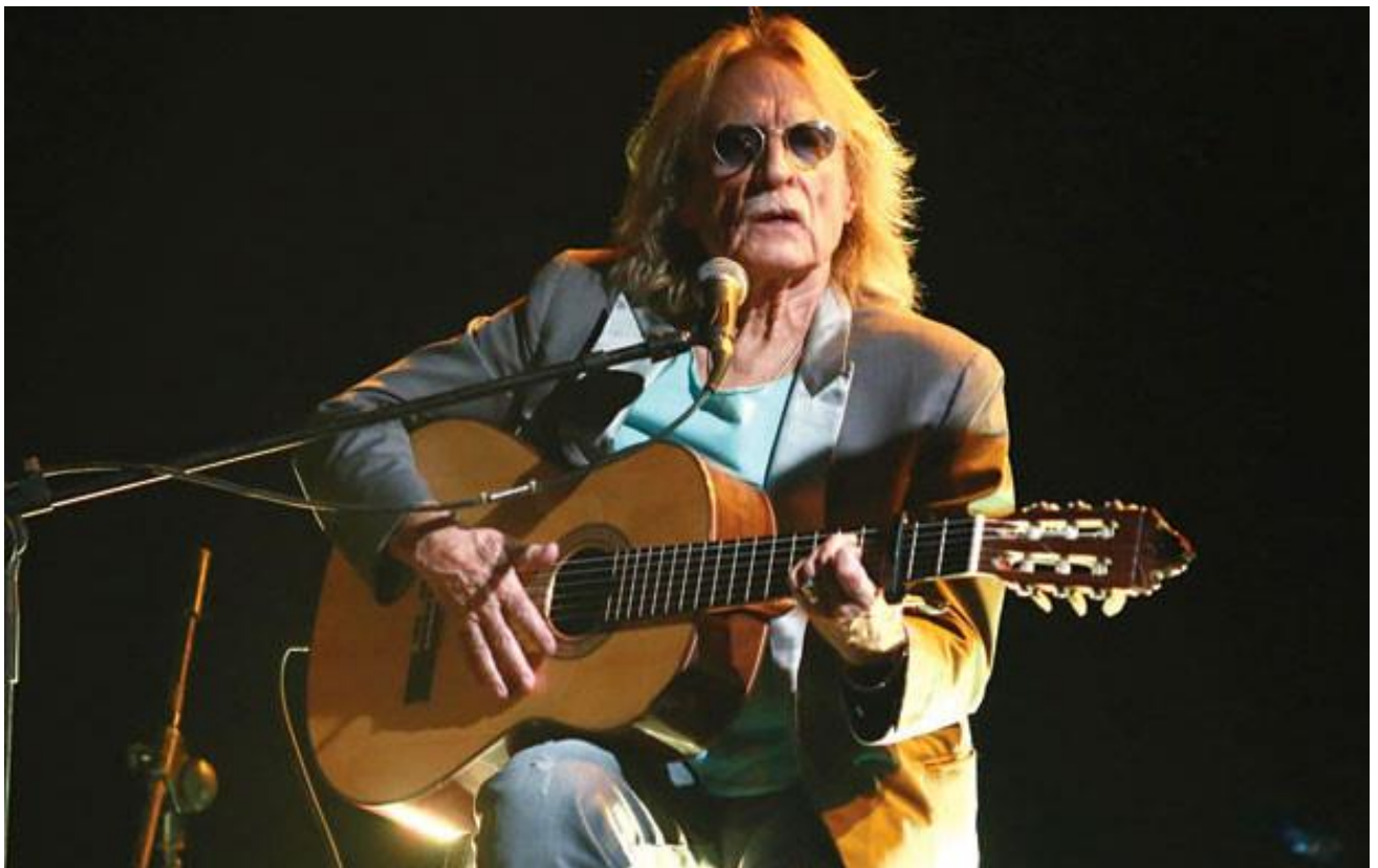
Christophe biểu diễn tại TP.HCM đêm 23/11/2013.

Đến cuối thập niên 1960, khi hào quang đang chói lọi, Christophe gần như biến mất khỏi sân khấu. Năm 1973, 1975, 1978 ông có trở lại với vài tác phẩm như Les paradis perdus , Les mots bleus , Le beau bizarre... nhưng dấu ấn thực sự phải kể đến bài Succès fou ra mắt năm 1983, với khoảng 600.000 đĩa bán ra. Năm 1996, ông gần như “phản bội” chính mình khi trở lại với album Bevilacqua đầy tham vọng. Đây là một thể nghiệm của nhạc điện tử, đánh dấu sự chuyển hướng mạnh mẽ trong tư duy âm thanh và sáng tác, khác xa những gì từng ghi đậm dấu ấn Christophe với làng nhạc thế giới. Năm 2008, album Aimer ce que nous sommes cũng tiếp tục con đường này, đồng thời kết hợp cả các thể nghiệm về âm nhạc thị giác, điện ảnh. Christophe chấp nhận thể nghiệm thì khó lòng thu hút người nghe hoặc khán giả tức thời; chưa nói, có khi còn “đi ngược” thị hiếu định sẵn của những người từng yêu mến ông. Và do đó ông không mấy thành công với những ca khúc mới.