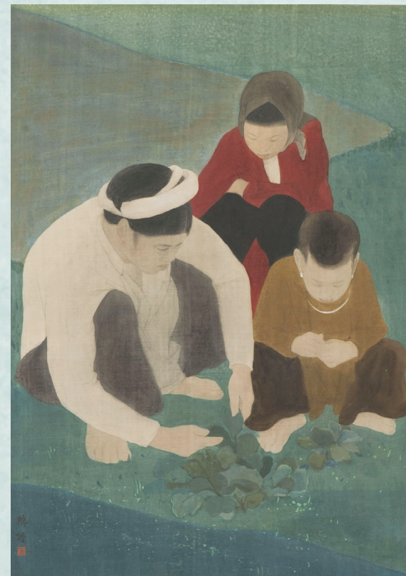
“Hái rau” (lụa, 66,5 x 50cm) - họa sĩ Lê Phổ (1907-2001)