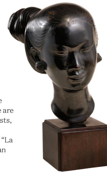
"A Lao Woman" (Copper, 24cm) - Bien Hoa College of Decorative Arts

Currently, she remains busy with projects related to Vietnam's cultural and artistic heritage while helping to raise funds for the Cernuschi Museum in France to restore Vietnamese cultural artifacts for display. She also continues to research and present Vietnamese lacquer. 🌸