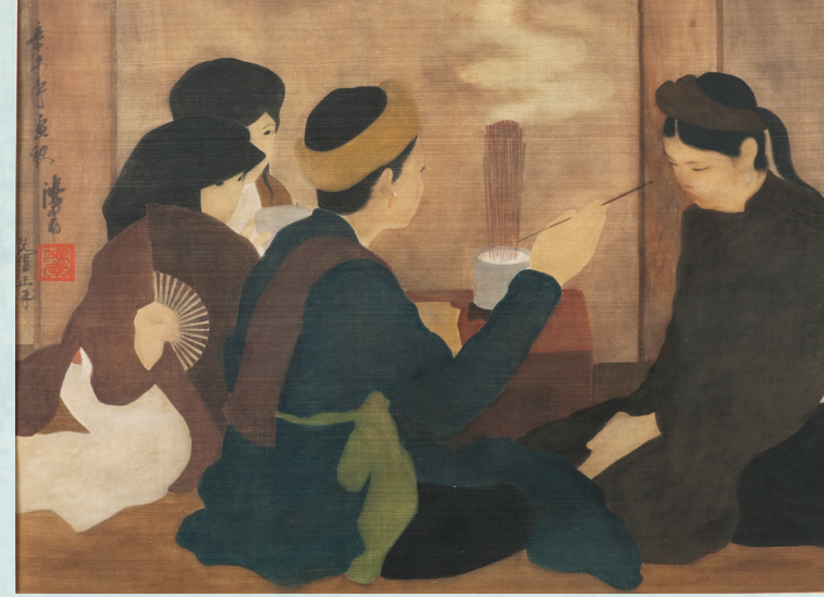
“Lên đồng” (lụa, 63,5 x 87,5cm) - họa sĩ Nguyễn Phan Chánh (1892-1984)

Cũng từ đó, bộ sưu tập nghệ thuật của bà nhiều dần lên, chủ yếu được thu thập từ các cuộc đấu giá, chợ đồ cổ, các phòng tranh ở khắp nơi. Hiện vật nhiều lắm, từ tranh tượng đến sách quý, đồ cổ các thời kỳ. Tiêu chí chọn của bà là quý hiếm, có giá trị lịch sử, đẹp, và toàn vẹn.