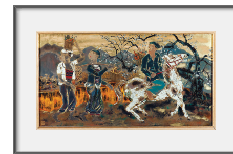
"Meet-up" (lacquer, 60 × 110.5cm) by Nguyen Tien Chung (1914-1976)