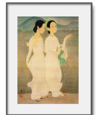
"Two Girls" (silk, 68.5 × 48.5cm) by Mai Trung Thu (1906-1980)